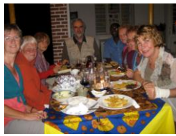
diner in Thai Jazz