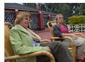
Marleen met mitella