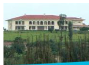
Musée Arts Modernes Rwanda