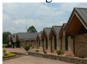
Musée Nationale Butare

Om half 12 vertrokken we met een toch nog wat gammele Petra naar Nyanza. Het wegdek was goed maar de weg was lang en bochtig. Bij Nyanza waren we te moe en stelden het museumbezoek maar tot de volgende dag uit. We aten en sliepen heerlijk in hotel IBIS in Butare.