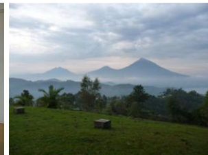
Vulkanen vanuit Remera gezien