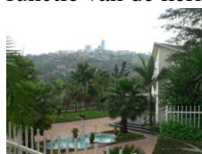
Gisozi Memorial Centre