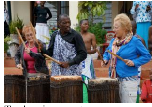
Tambourineuses et - ...neur