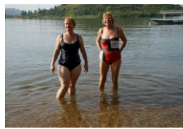
Baadsters in Lac Kivu