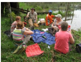
Picnic bij Lac Ruhondo

Na een bezoek aan de theefabriek van Cyohoha kwamen we in Remera- Ruhondo aan. Als altijd was daar de ontvangst en omgeving geweldig. We konden er wandelen, zien hoe er aan de restauratie van het slakkenhuis gewerkt werd ( P 4.1), en de stilte op ons in laten werken. De vulkanen lieten zich er bij aankomst in volle glorie zien aan de horizon.