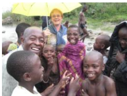
Bij de warme bronnen