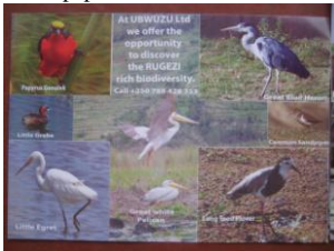
Rugezi Wetlands Birds