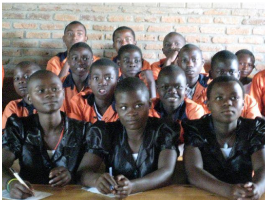
(Compassion PCR Gisenyi)