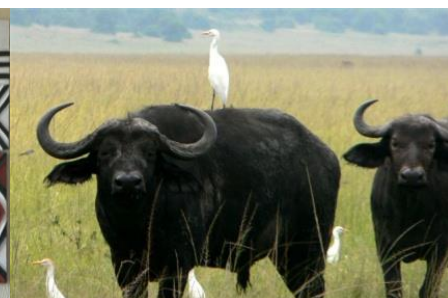
Buffels met koereigers