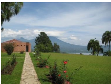
Kapel van Remeha Ruhondo