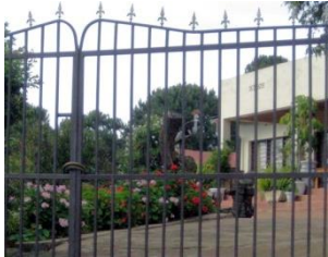
gesloten hek Ubwuzu