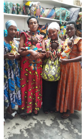
“ de 3 e groep stagiaires “

Jan heeft uitgebreid met de vrouwen gesproken. Zij realiseerden zich dat de aankoop van een geschikt huis toch nog verder is dan gedacht. 25.000 euro is nu beschikbaar (het aanvankelijk ingeschatte bedrag). IFUNI gaf 15.000 euro, zij zelf spaarden 10.000 euro. Een enorme prestatie! Als Stichting hebben we gezegd dat we wel wilden proberen bij een renteloze lening te bemiddelen maar dat wij nu stoppen voor dit goede doel. Ook kunnen ze overwegen dit geld onderling onder de ouderen te verdelen en het ieder zelf te beleggen. Dat scheelt mogelijk heel wat juridische complicaties. In elk geval was men heel blij met onze bijdrage! Er zijn nu geregeld stageaires, dankzij steun van stichting "de Houtmaat". Dat is een goede basis voor de toekomst van het atelier. Ook al blijven de stageaires niet allemaal, ze praten en denken mee! En hebben een vak geleerd!