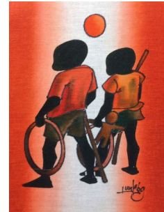
kinderen die aan de kant staan,