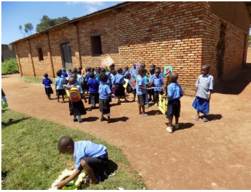
Kleuters bij de kapel,