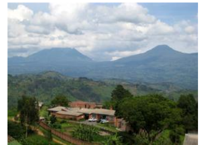
Foyer de Charité Remera Ruhondo