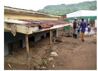
volgelopen huis bij de brouwerij

Rwanda heeft altijd goede regens gehad. Reden waarom het verhoudingsgewijs zo dicht bevolkt is. Maar de laatste jaren is het buitensporig af en toe, waardoor wegen geblokkeerd raken door grondverschuivingen, en bruggen weggespoeld worden door woeste bergbeken. In Kigarama waren zo 9 huishoudens dakloos geraakt, en dus voorlopig maar ondergebracht in kapel en schoollokalen. De maïsogst was ernstig beschadigd. Door de opgelegde monocultuur per regio hebben de boeren geen reserves meer als voorheen toen ze nog zelfvoorzienend waren en diverse gewassen teelden. Nu wordt er honger geleden, ook in vruchtbare dalen. Jongelui trekken weg naar Congo of Uganda.